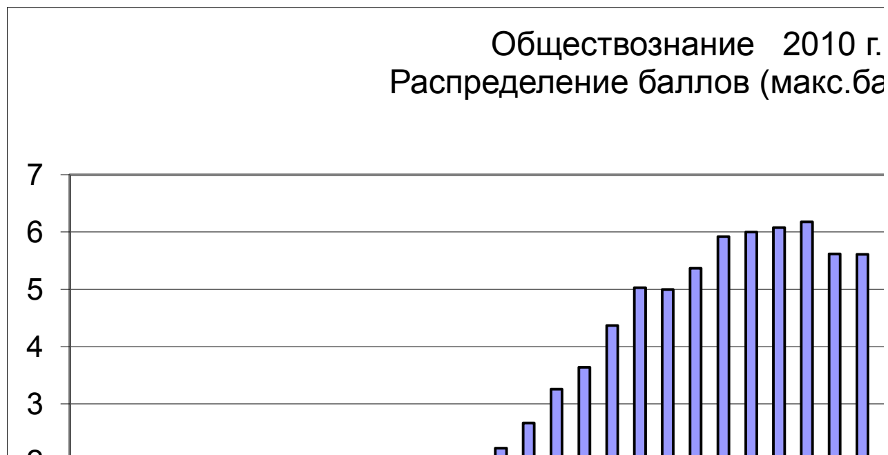
Рисунок 7.1. Распределение первичных баллов экзаменуемых

На рисунке 7.2 показано распределение отметок по пятибалльной шкале, полученных экзаменуемыми. Процент выполнения всей работы расположен в интервале от 58% до 70%. Не справились с работой (получили неудовлетворительную отметку) – около 2,6% экзаменуемых (в 2009 г. – 5,4%). Отметку «5» за выполнение работы получили около 8,8% участников экзамена (в 2009 г. – 7,9%), отметки «3» и «4» – соответственно 35,6% и 53,0% (в 2009 г. – 36,9% и 49,8%).